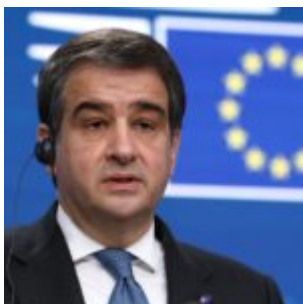
Il vicepresidente della commissione Ue, Raffaele Fitto

Il vicepresidente esecutivo della commissione Ue, Raffaele Fitto, ha insistito che una priorità di Bruxelles è "rendere più efficaci gli investimenti" e, al tempo stesso, "continuare con il legame tra investimenti e riforme che ha caratterizzato il Pnrr". Fitto ha anche ricordato come l'acqua sia una priorità ormai per l'Unione europea: già il Pnrr "era partito con un miliardo, ne ha aggiunto uno alla prima revisione e un altro con lo strumento finanziario introdotto dall'ultima revisione". Poi è arrivata la riprogrammazione di mid term dei fondi di coesione 2021-2027, in cui l'acqua è una delle cinque priorità. Tornando sul Pnrr, Fitto ha detto che "la vera lezione del Pnrr è stata la flessibilità introdotta con il meccanismo delle revisioni: necessaria per una programmazione pluriennale, come ha dimostrato invece in passato proprio la rigidità dello stesso bilancio Ue e della politica di coesione. Il vero punto di svolta - ha concluso Fitto - lo vedremo con il nuovo bilancio 2028-2034 e con la riforma della politica di coesione".