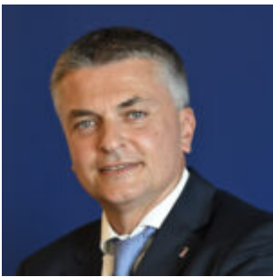
Il viceministro alle Infrastrutture, Edoardo Rixi

Il viceministro alle Infrastrutture, Edoardo Rixi, ha anzitutto ripercorso il tragitto del Pniissi, accelerato grazie a un "metodo" che è stato portato avanti proprio dal MIT. Ma "la questione centrale è la semplificazione" che Rixi interpreta soprattutto come mezzo per realizzare le opere. "Se non diciamo chiaramente che realizzare infrastrutture è la priorità e questo interesse prevale sugli altri, le opere non si fanno". Una priorità