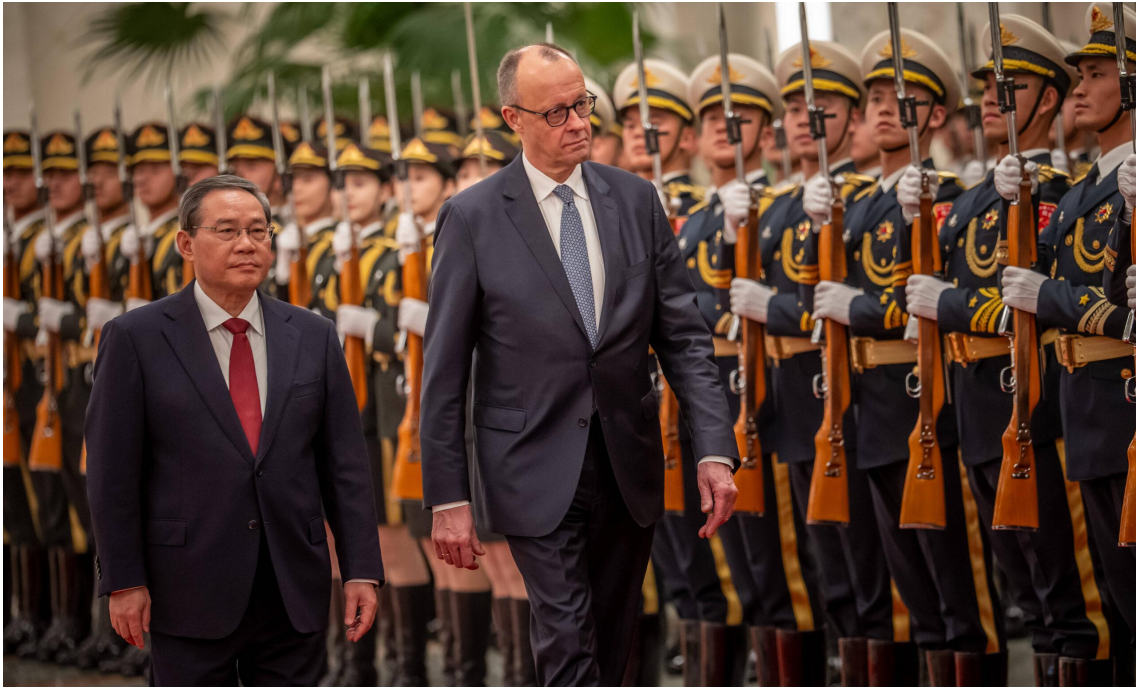
Merz a été accueilli avec les honneurs militaires par Li Qiang, Premier ministre chinois, dans le Grand Hall du Peuple.