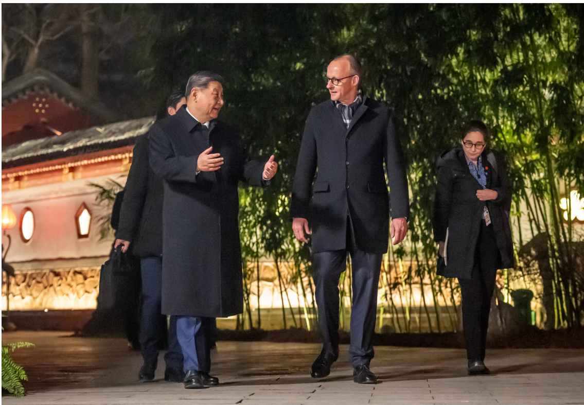
Le chancelier fédéral Friedrich Merz avant son dîner avec Xi Jinping, président de la Chine, à la résidence d'État, accompagné d'interprètes.

Les Chinois savent parfaitement comment jouer là-dessus. Ils se savent très chanceux que Donald Trump soit aussi ambivalent à l'égard de la Chine et aussi agressif avec ses alliés et l'ordre international. Ils étaient très inquiets au sujet de l'AUKUS, du Quad et même de l'OTAN. Grâce à Trump, ces craintes passent un peu au second plan.