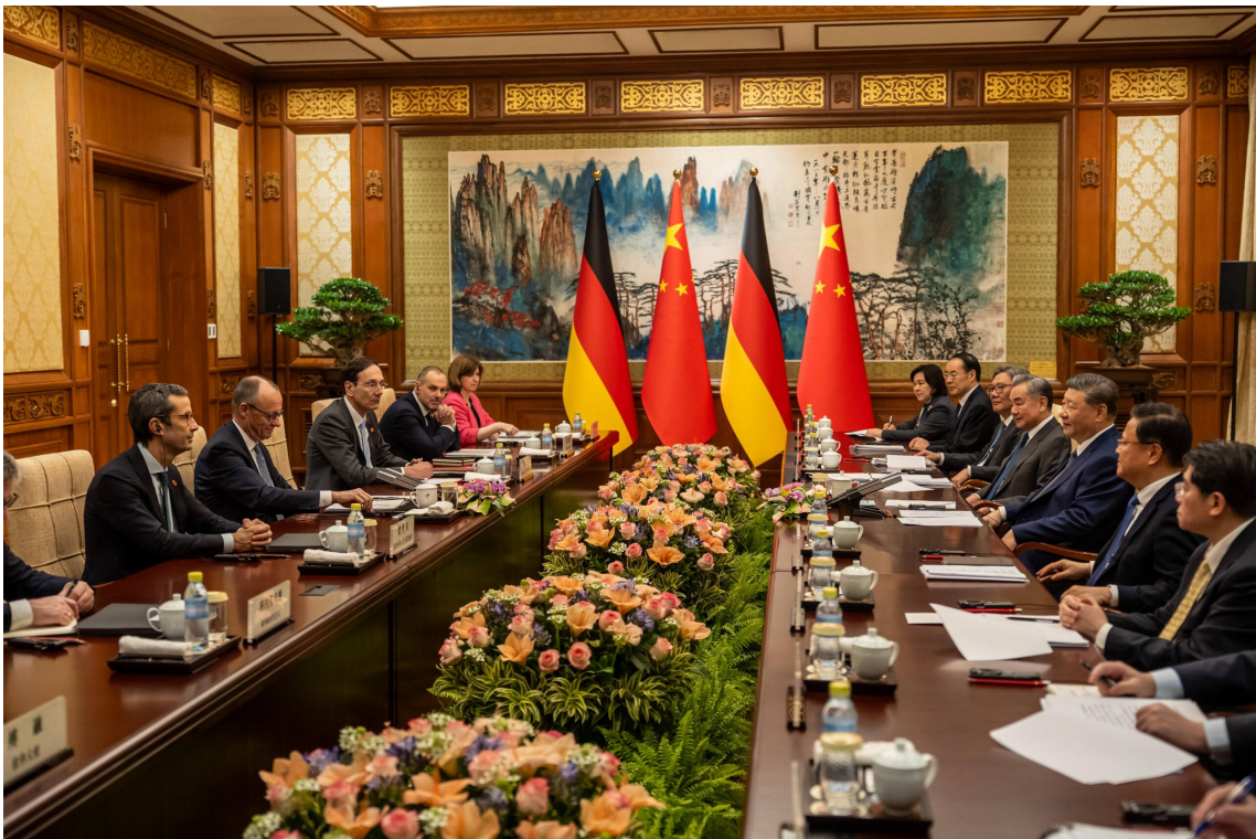
Friedrich Merz se rend en Chine pour la première fois en tant que chancelier.

En amont de cette visite, il a organisé un nouveau dîner avec des universitaires et des personnalités issues du monde des affaires.