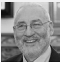
Joseph E. STIGLITZ

Docente di Economia, Columbia University, New York, USA, Premio Nobel per l'Economia nel 2001