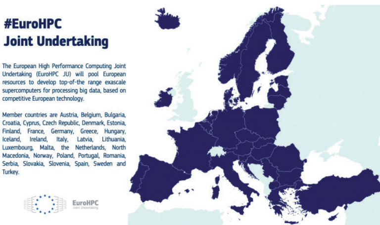
Fig. 2 – Paesi membri partecipanti a EuroHPC (Fonte: Unione Europea)

Un ulteriore passo avanti è avvenuto con l'approvazione da parte del Consiglio (13 luglio 2021) del Regolamento 42 che consente la prosecuzione delle attività dell'attuale impresa comune EuroHPC, raccogliendo le risorse provenienti dall'UE, dai 27 Stati membri, da sei altri paesi (Figura 2) e da tre rappresentanti dei partner privati: l'European Technology Platform for High Performance Computing (ETP4HPC) 43 , la Big Data Value Association (BDVA) 44 e la European Quantum Industry Consortium (QuIC) 45 .