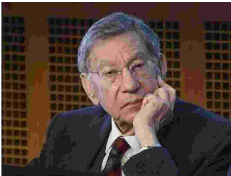
Cesare Mirabelli, presidente emerito della Corte Costituzionale, è nato nel 1942

La proposta Nordio non arriva in Parlamento per i tanti decreti? Al Senato ce ne sono pochi. Partite dal Senato, i tempi si accorceranno»