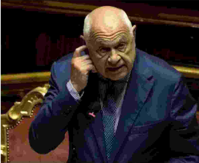
Il ministro della Giustizia Carlo Nordio è nato a Treviso 76 anni fa