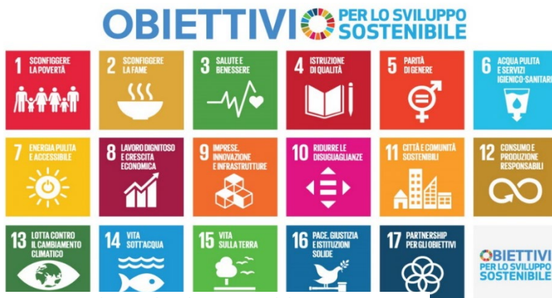
Figura 11 17 Obiettivi di sviluppo sostenibile

I numerosi intenti dell'Agenda 2030 per lo Sviluppo Sostenibile prevedono 17 obiettivi, definiti Sustainable Development Goals, SDGs mediante la declinazione di un programma di azione, adottato dalle Nazioni Unite all'unanimità da parte dei 193 Stati membri, che ambisce ad estirpare la povertà, garantire la prosperità e la pace e proteggere e mettere in sicurezza il pianeta.